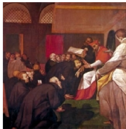
Duomo di Milano, quadroni con una scena della vita di san Carlo.