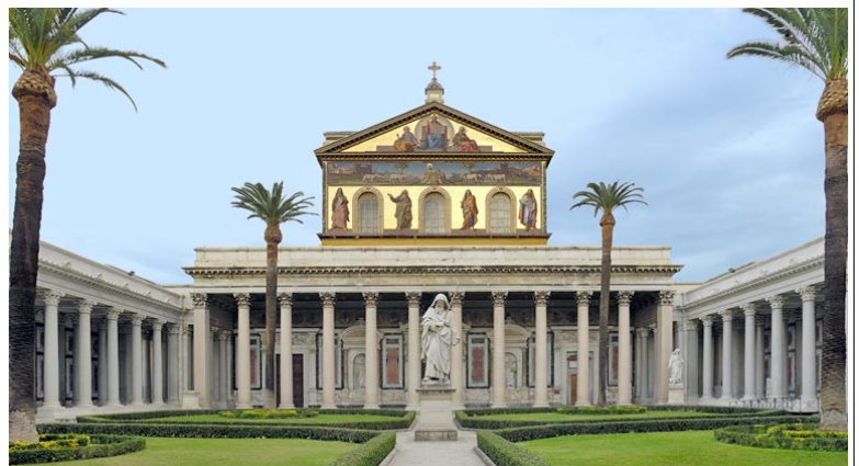
La Basilica di S. Paolo fuori le mura a Roma