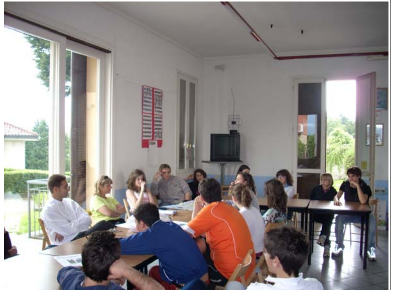
Gli animatori preparano l'attività dell'Oratorio

Ci chiediamo non soltanto: Chi era Paolo? Ci chiediamo soprattutto: Chi è Paolo? Che cosa dice a me? In questa ora, all'inizio dell'"Anno Paolino" che stiamo inaugurando, vorrei scegliere dalla ricca testimonianza del Nuovo Testamento tre testi, in cui appare la sua fisionomia interiore, lo specifico del suo carattere. Nella Lettera ai Galati egli ci ha donato una professione di fede molto personale, in cui apre il suo cuore davanti ai lettori di tutti i tempi e rivela quale sia la molla più intima della sua vita. «Vivo nella fede del Figlio di Dio,