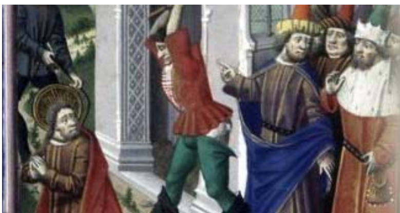
Alcune raffigurazioni della vita di S. Paolo: la conversione, il naufragio a Malta, il martirio.

aggiunge: come, secondo il Libro della Genesi, l'uomo e la donna diventano una carne sola, così Cristo con i suoi diventa un solo spirito, cioè un unico soggetto nel mondo nuovo della risurrezione (cfr 1Cor 6,16ss). In tutto ciò traspare il mistero eucaristico, nel quale Cristo dona continuamente il suo Corpo e fa di noi il suo Corpo: «Il pane che noi spezziamo, non è forse comunione con il Corpo di Cristo? Poiché c'è un solo pane, noi, pur essendo molti, siamo un corpo solo: tutti infatti partecipiamo dell'unico pane» (1Cor 10,16s).