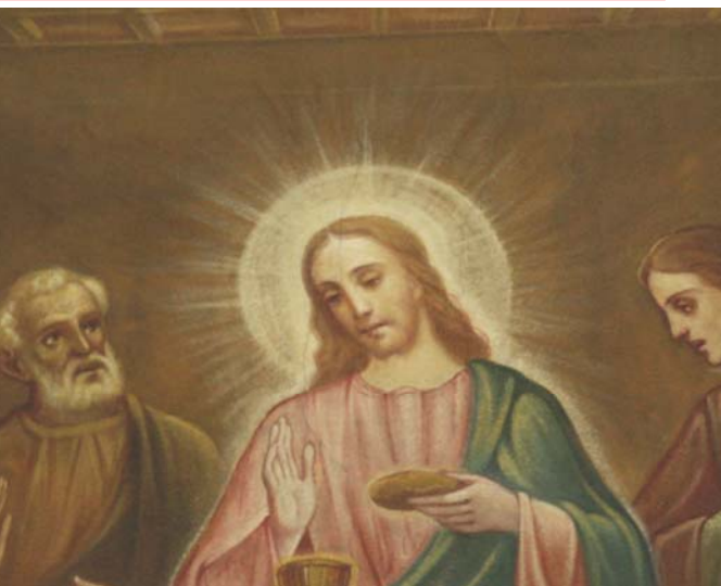
Affresco nella Chiesa di Varano