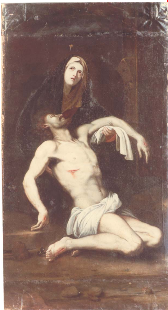
Immagine dell'Addolorata nella Chiesa di Varano