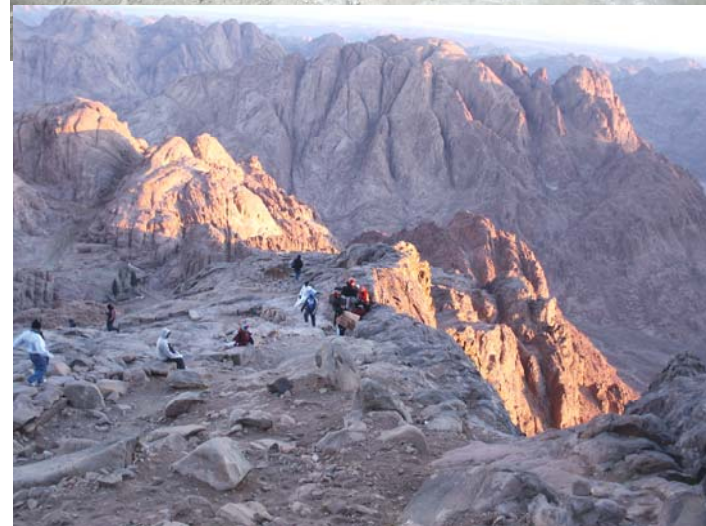
Il Monte Sinai

E' confermato per le date 5-12 ottobre 2010. E' ancora possibile iscriversi, ma occorre farlo al più presto . Programma sul Notiziario di giugno.