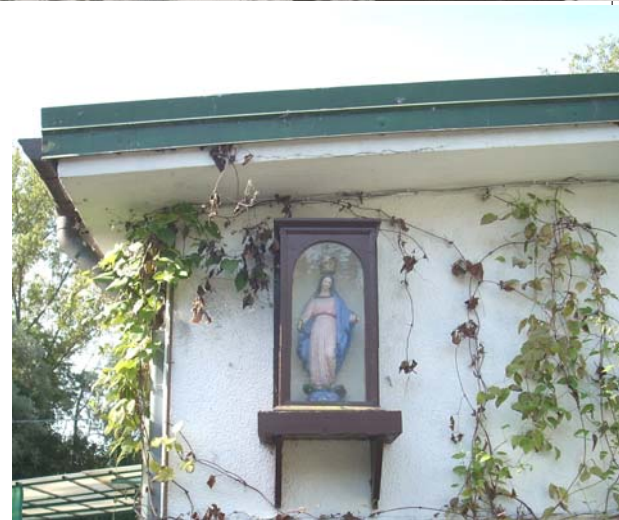
La "Madunina" del Campeggio

Celebrata la sera del giorno 14 agosto la celebrazione eucaristica ha visto la partecipazione di un buon gruppo di Varanesi e di molti campeggiatori, soprattutto giovani, nonostante la pioggia: è un buon auspicio e smentisce il luogo comune della superficialità e indifferenza religiosa delle giovani generazioni.