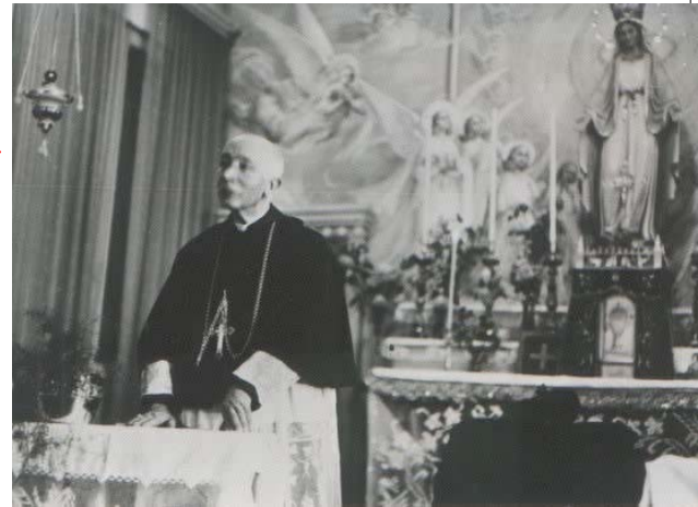
Il Beato Cardinale A.I. Schuster

E' stata celebrata solennemente domenica 8 agosto, nel ricordo felice della presenza tra noi del Beato Cardinale Alfredo Ildefonso Schuster, nella sua seconda Visita pastorale: la memoria del suo ministero episcopale rimane sempre viva in chi l'ha conosciuto.