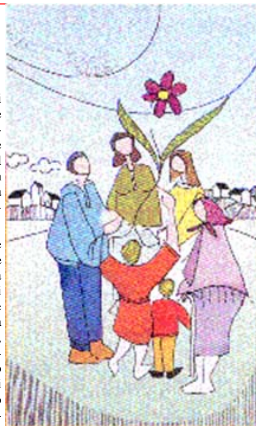
La famiglia è in se stessa una buona notizia

Quando abbiamo trovato la nostra rete di riferimento, ci siamo sentiti più sicuri e con la percezione di possibilità nuove davanti a noi. Abbiamo un po' alla volta imparato ad apprezzare le persone che stavamo conoscendo e ad accoglierne i limiti, così come loro accoglievano i nostri; abbiamo fatto e stiamo facendo con loro esperienze belle e rilevanti, vissuto momenti importanti come coppia e come gruppo.